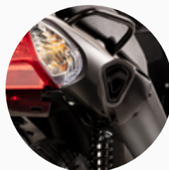
Escape de diseño deportivo