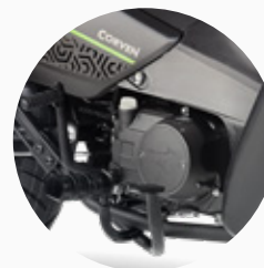
Pedalera tipo racing.