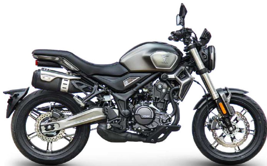
TITANIUM SILVER GREY